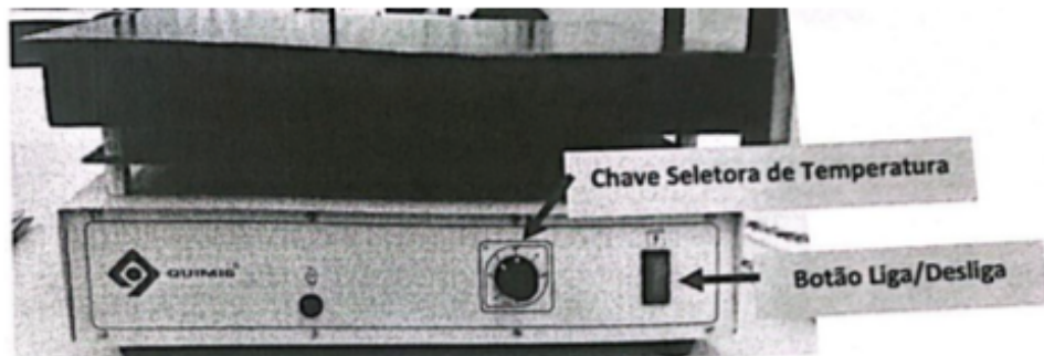
Vista anterior chapa de aquecimento